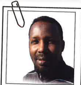
Apostolin kyydillä - sivu 11