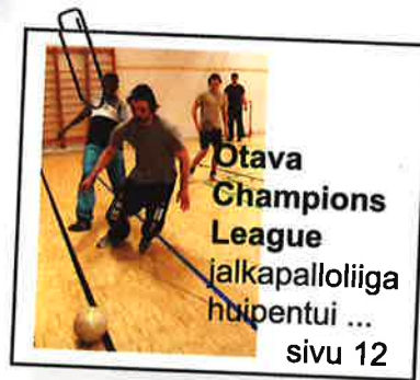
Otava Champions League jalkapalloliiga huipentui ... sivu 12