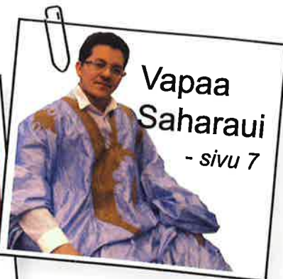
Vapaa Saharaui - sivu 7