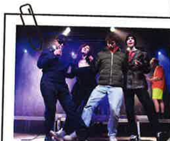
Menestys nimeltään S.O.F - sivu 11