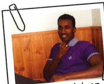
Minun suomalainen unelma - sivu 5