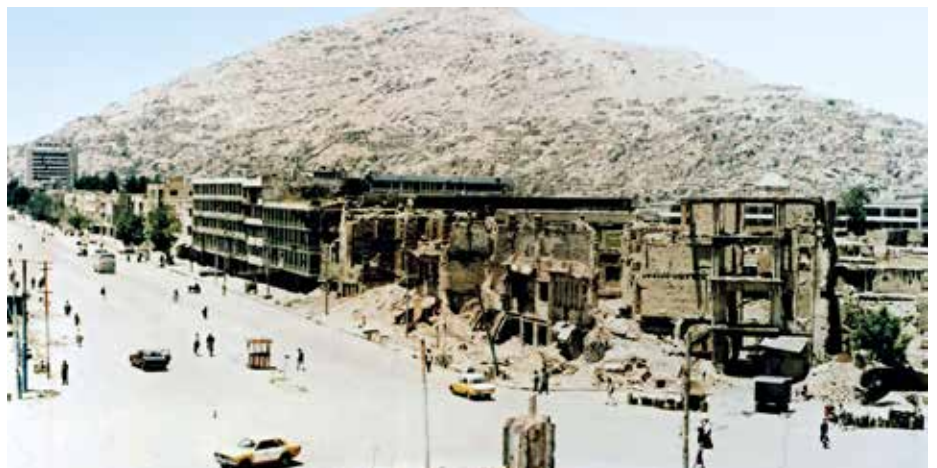
Tuhoutuneita rakennuksia Kabulissa sisällissodan aikana vuonna 1993.

Viralliset kielet: Paštun- ja Darin kieli